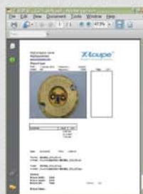
X-Loupe Solution Premium 图像分析报告制作功能