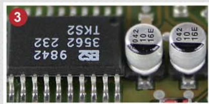
图③是应用X-Loupe Solution Premium的景深扩展功能 合成①、②的效果