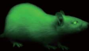
UCRL超微距环形光源在 GFP蛋白质荧光影像应用