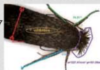
X-Loupe Solution Premium 的长度、角度、面积量测与 注解功能